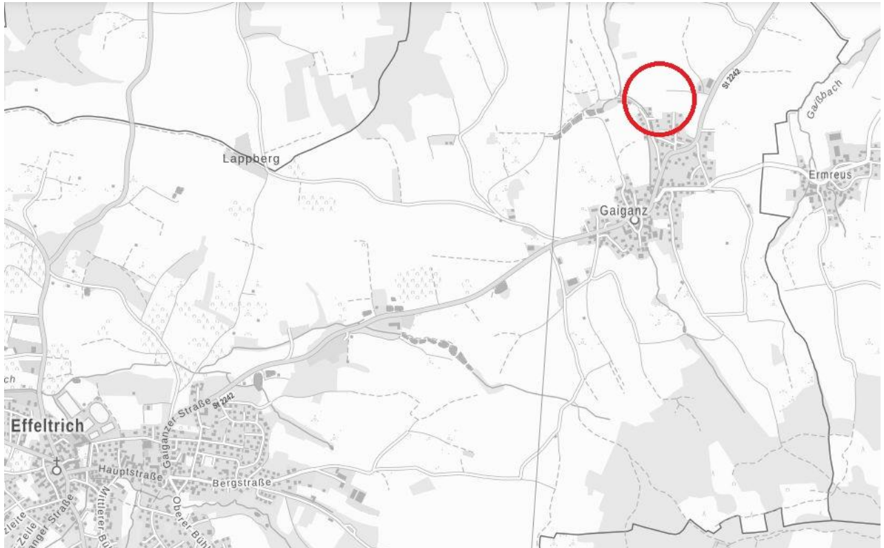
Übersichtslageplan mit Änderungsbereich (s. Kreis)

Der Gemeinderat der Gemeinde Effeltrich hat am 11.09.2023 beschlossen, im Norden des Gemeindeteils Gaiganz den Bebauungsplan „Gaiganz Nord 1“ mit integriertem Grünordnungsplan aufzustellen. Vorgesehen ist die Aufplanung eines allgemeinen Wohngebietes. Da dieser Bereich in der vorbereitenden Bauleitplanung (Flächennutzungsplan) als Fläche für die Landwirtschaft ausgewiesen ist, muss im Flächennutzungsplan eine Änderung in Wohnbaufläche vorgenommen werden. Die Lage des Änderungsbereichs kann dem nachfolgenden Übersichtslageplan entnommen werden.